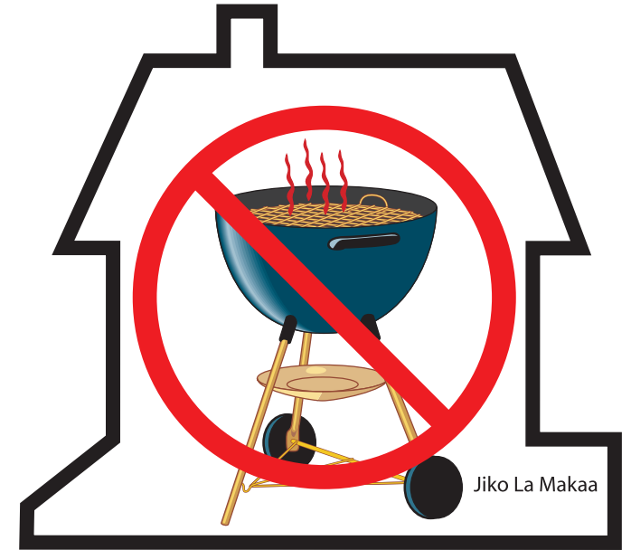
Jiko La Makaa