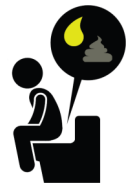
ጸሊም ሽንቲ፣ ጸምሎው ሓርኢ፣ ውጽኣት

ገለ ሄፓቲተስ A ዘለዎም ሰባት ግን ዋላሓንቲ ምክታት ዘይከህልዎም ይኸእሉ እዮም