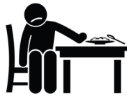
ሽውሃት መግቢ ዘይምህላው