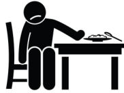
የምግብ ፍላጎት ማጣት