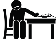
የምግብ ፍላጎት ማጣት