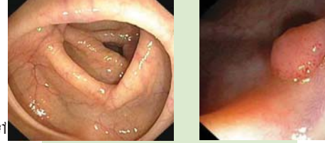
ពោះវៀនធំដែលមានសណ្ឋានស្អាតល្អ (នៅខាងឆ្វេង) ជួយអ្នកថែទាំសុខភាព ឱ្យអាចរកឃើញរូបសាស្ត្រពោះវៀនធំ (នៅខាងស្តាំ), ហើយដែលអាចកាត់យកចេញទាំងស្រុងនៅក្នុងអំឡុងពេលធ្វើខ្លួនលាស់ខ្លី។