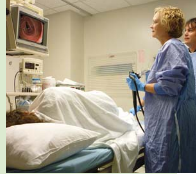
អ្នកផ្តល់សេវាថែទាំសុខភាពនឹងពិនិត្យពោះវៀនធំរបស់លោកអ្នក ដើម្បីរករូបសាស្ត្រពោះវៀន ដែលជាដុំសាច់ដុះក្នុងពោះវៀន ដែលអាចកើតទៅជាជម្ងឺមហារីក។